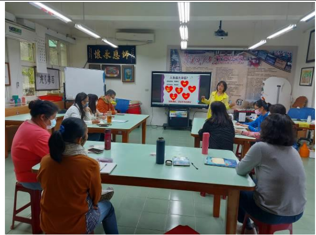
照片說明:如何有效經營家人關係，人的一生有許多努力的方向和追求的目標，而家人關係卻是可以維繫一生，有良好家人關係，可以給予人心安定