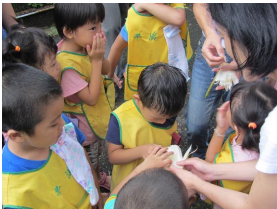
*說明：春天寄來一封批~下課探險去，看！開花了！發現春天在哪裡！