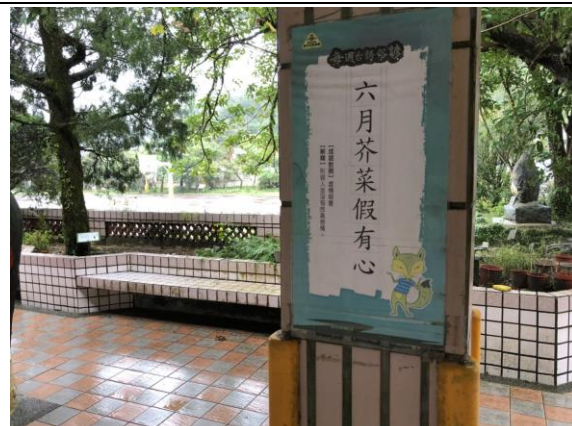
*說明：諺語知多少~走廊柱子