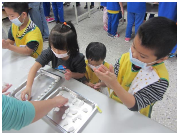
*說明：掌圓仔歌~搓湯圓體驗