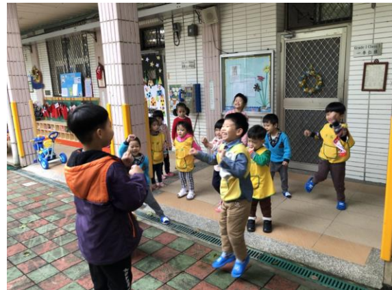
*說明：配合小學課間操活動，一起來跳《練武功》~