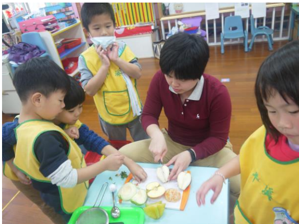
*說明：好食的水果~水果品嘗