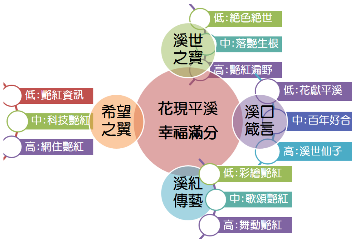
圖3：平溪國小花現平溪幸福滿分課程地圖