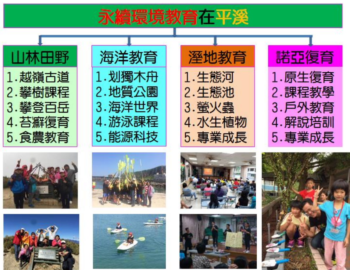
圖2：平溪國小永續環境課程地圖