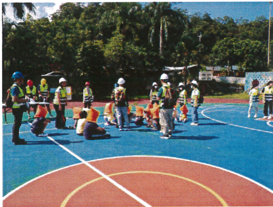
地點：操場 時間：112年9月21日 說明：集學生依據廣播指示，安靜迅速移動至避難地點