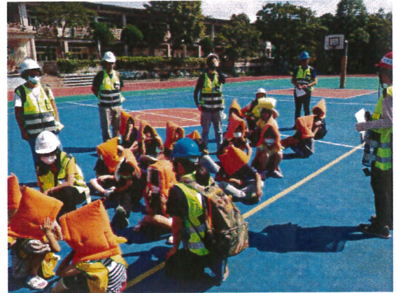
地點：操場 時間：112年9月21日 說明：集合各班導師迅速回報班級人數及學生狀況