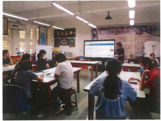
地點：校史室 時間：112年9月11日 說明：防震演練期程及相關事項討論