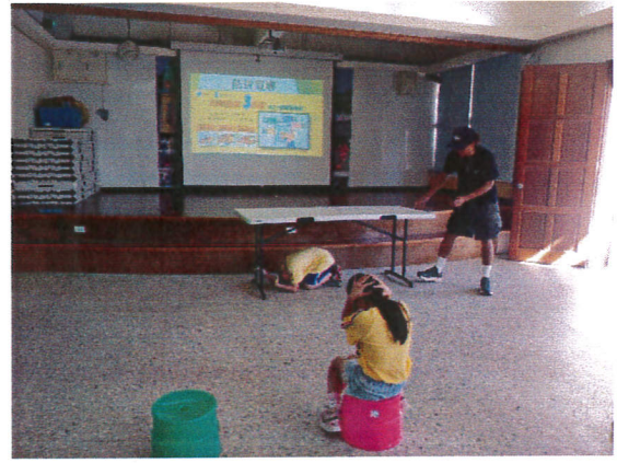
地點：仰山軒 時間：112年9月18日 說明：兒童朝會宣導全校防災宣導活動