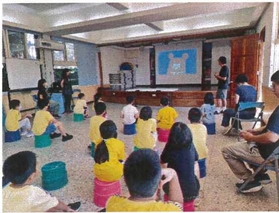
地點：仰山軒 時間：112年9月18日 說明：兒童朝會宣導全校防災宣導活動