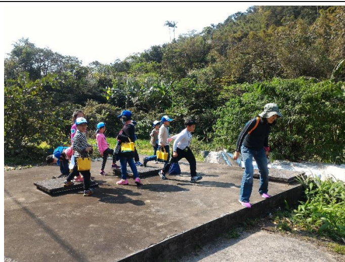
特色課程(踏查豔紅鹿子百合棲地)