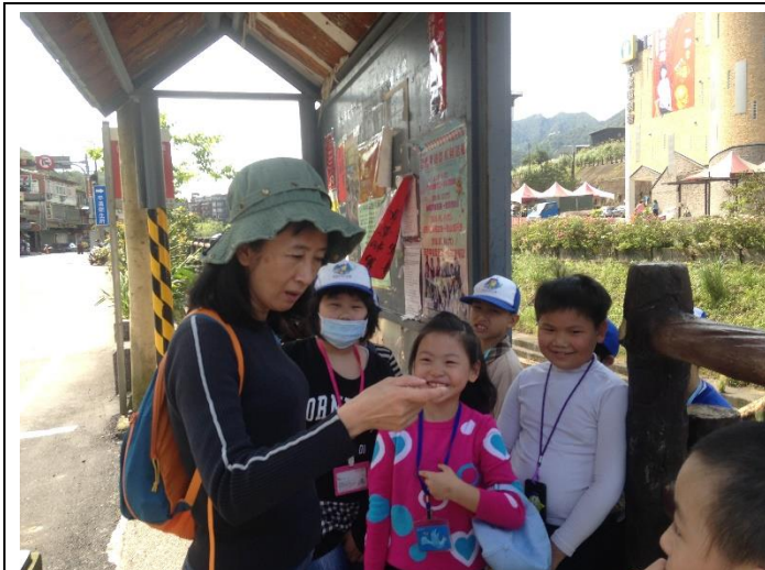
特色課程(踏查豔紅鹿子百合棲地)