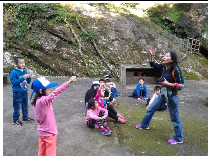
特色課程(踏查豔紅鹿子百合棲地)