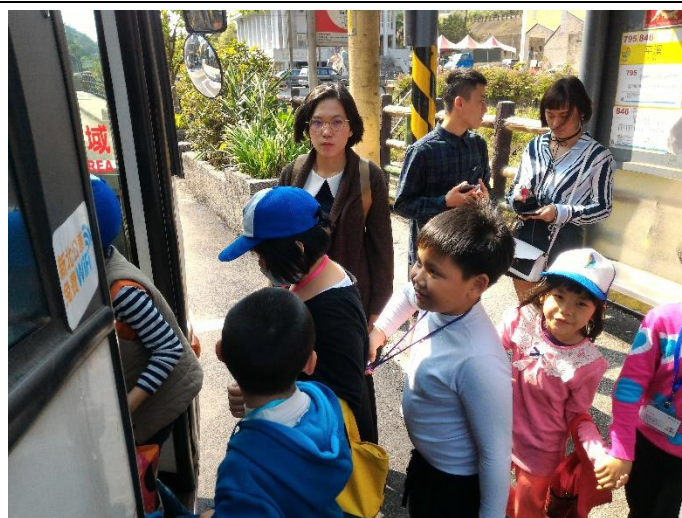
特色課程(踏查豔紅鹿子百合棲地)