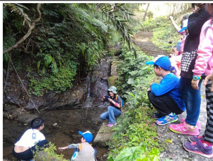
特色課程(踏查豔紅鹿子百合棲地)