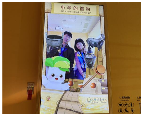
學校的帥哥老師及美女開心合影