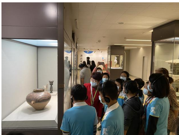
志工講師導覽解說