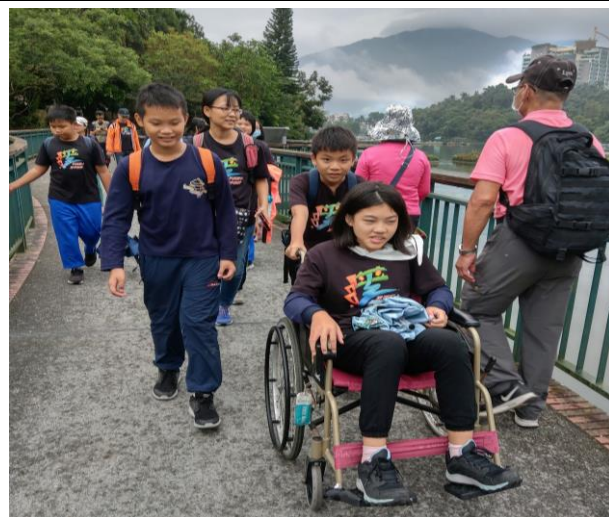
發揮同學愛，不讓一人落單