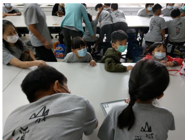
特生中心-飛羽追追追