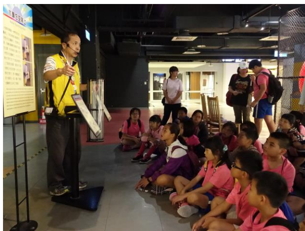
解說員為師生進行導覽解說