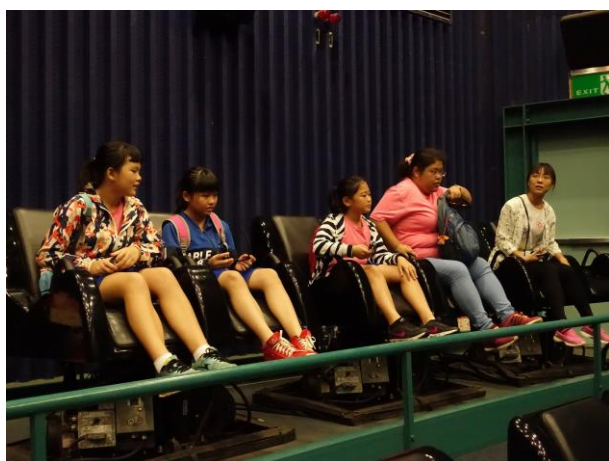
五年級師生進行動感體驗