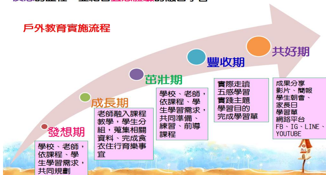
圖2：平溪國小戶外教育實施流程

平溪國小之戶外教育為透過走讀、操作、觀察、探索、互動、反思的歷程，並結合五感體驗的融合學習。