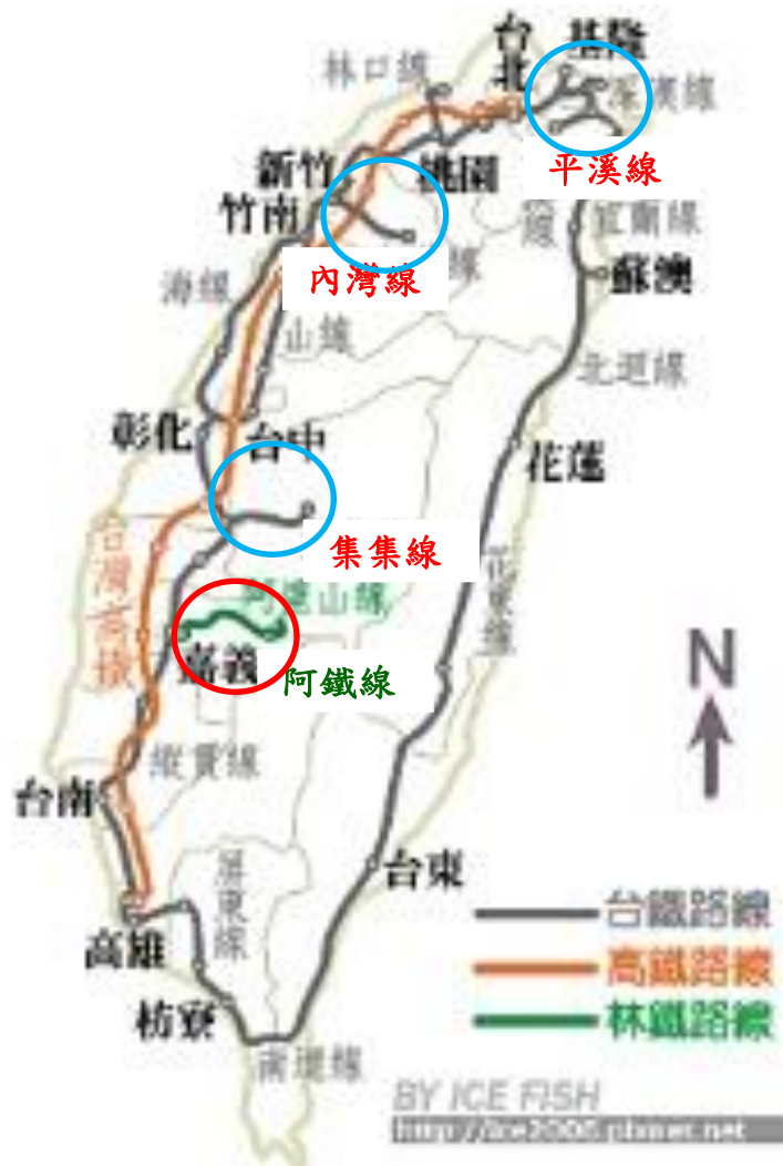
圖2：台灣鐵道三大支線及世界三大文化遺產鐵道(阿鐵線)