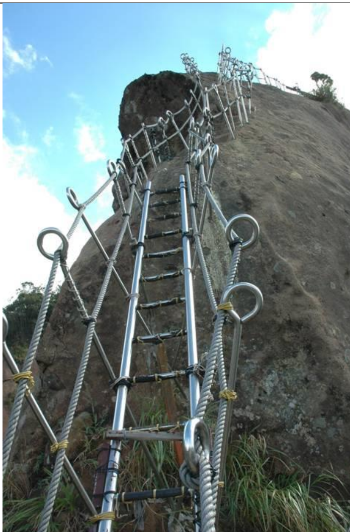
圖片說明：山頂風光