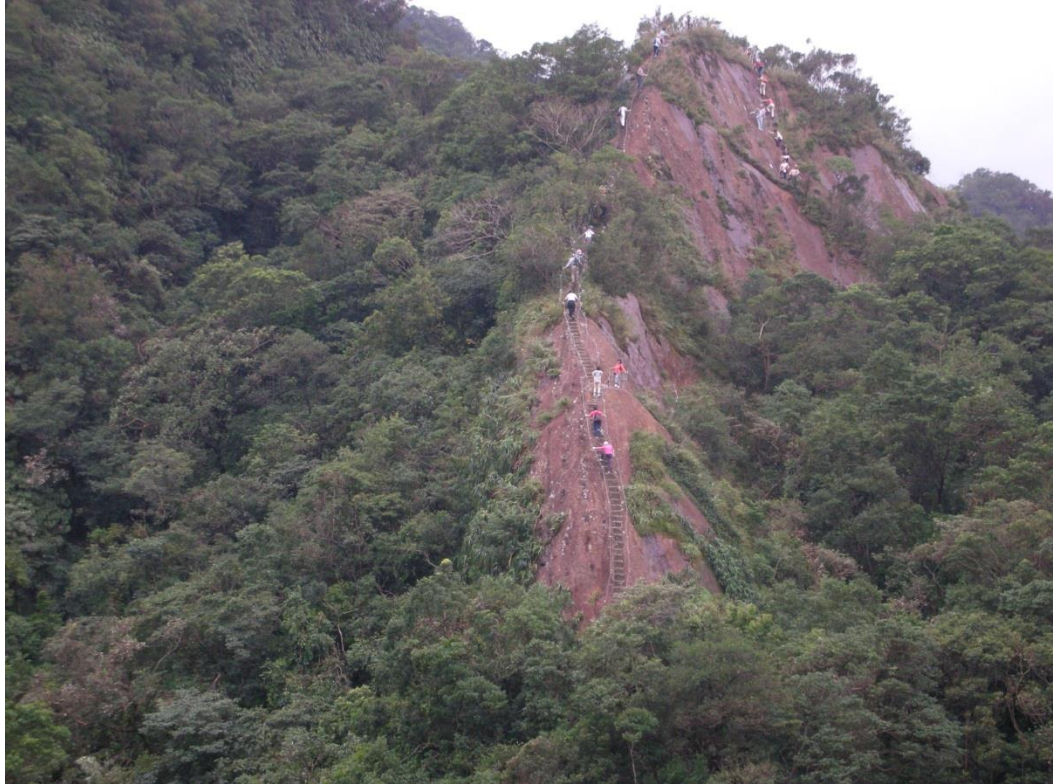
圖片說明：孝子山山峰之美