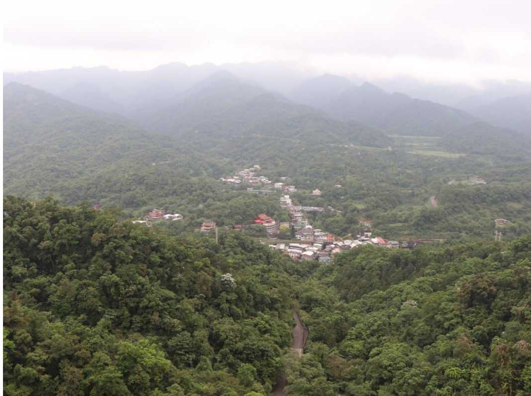
圖片說明：慈母峰稜線步道