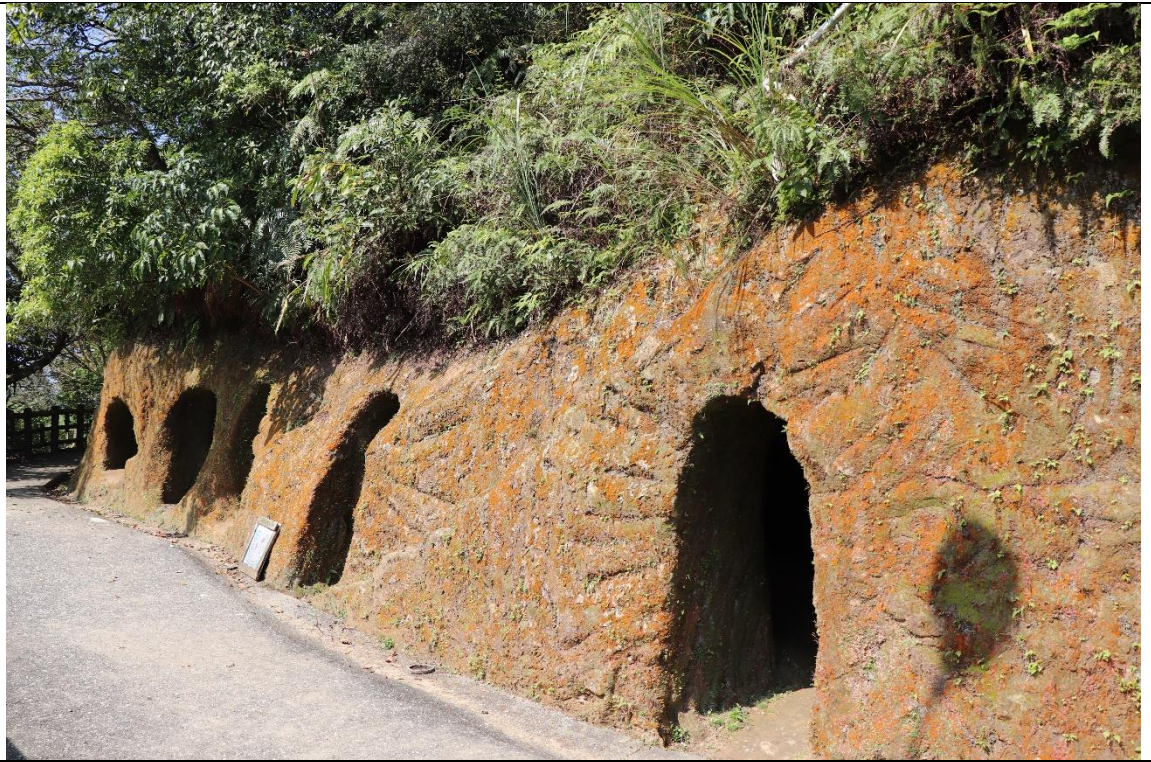
圖片說明：火車天上飛

平溪、十分、菁桐都有經典鐵道，火車行徑路線也別具特色。如，平溪火車天上飛，十分火車逛大街，菁桐火車倒退嚕。