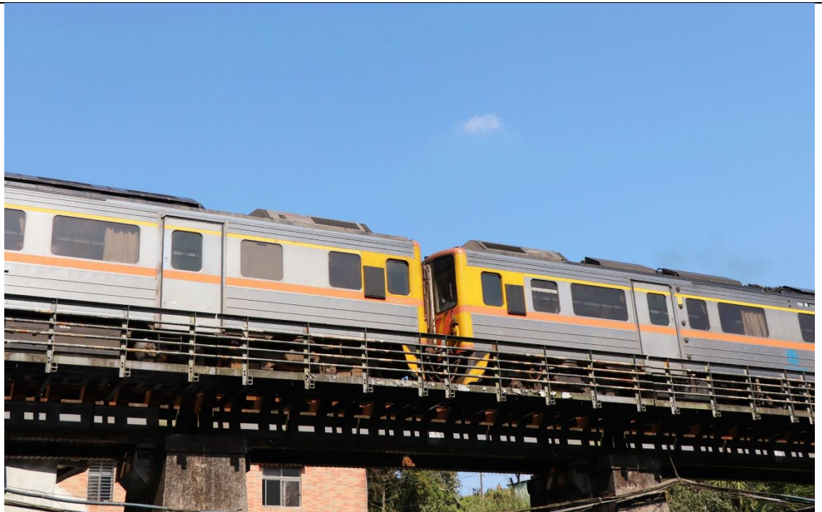
圖片說明：情人橋(觀音巖吊橋)

平溪、十分、菁桐都有經典鐵道，火車行徑路線也別具特色。如，平溪火車天上飛，十分火車逛大街，菁桐火車倒退嚕。