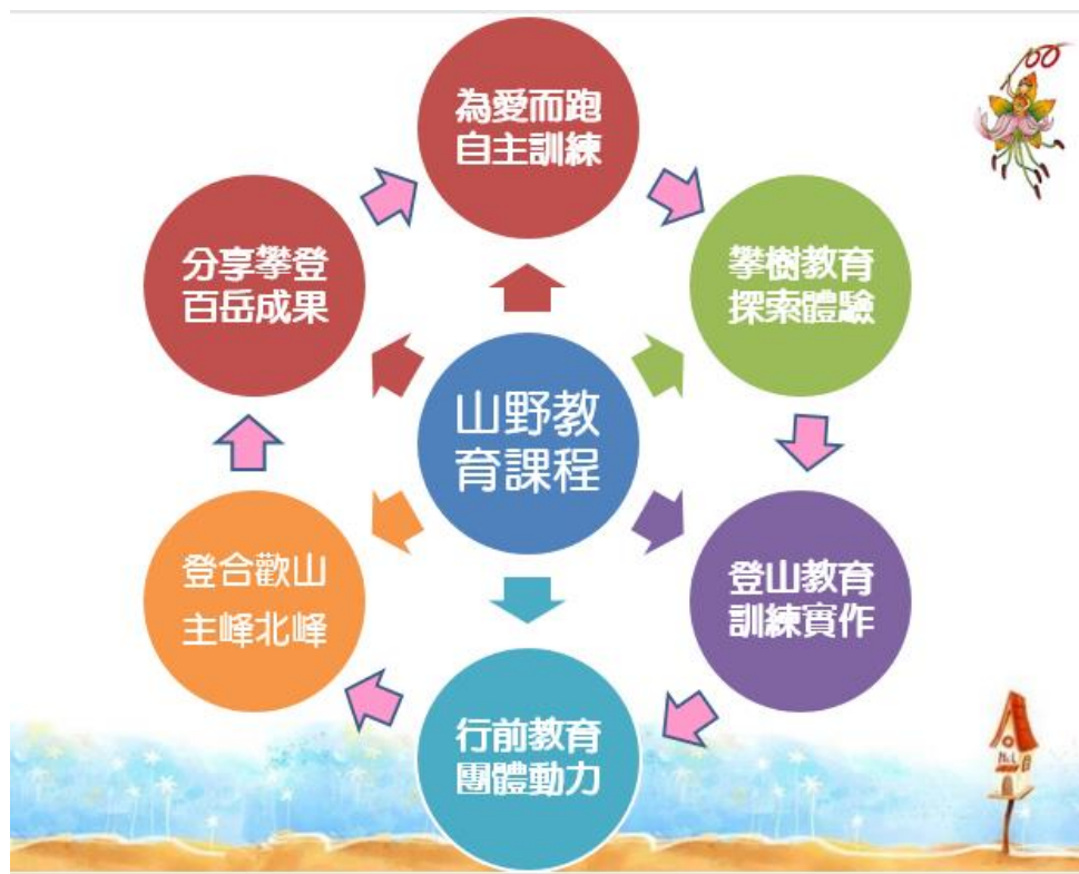
圖2：校本課程山林田野~登百岳、攀樹主題課程